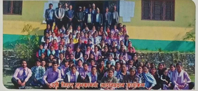
दशैं तिहार शुभकामना आदानप्रदान कार्यक्रम