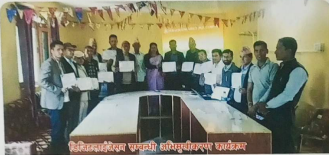
डिजिटल लाइब्रेरी सञ्चाली अभिसूचीकरण कार्यक्रम