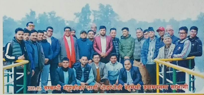
BBS सञ्चाली गाण्डकीका लागि धोडाधोडी बहुमुखी क्याम्पसमा सहभागी