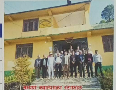
सम्पूर्ण क्याम्पसका स्टाफहरु