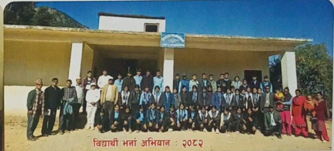
विद्यार्थी भर्ना अभियान : २०८२