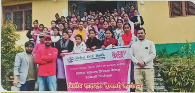
वित्तीय साक्षरता सन्ध्या कार्यक्रम