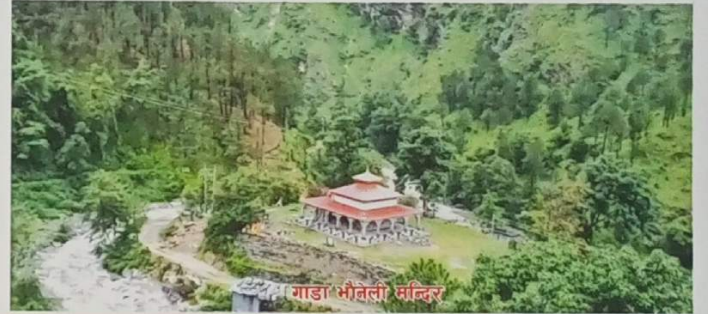
गाडा भौतली मन्दिर