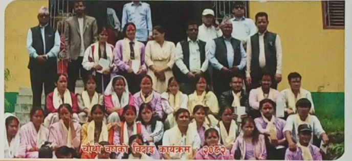
चौथा वर्षको विदाई कार्यक्रम - २०८२