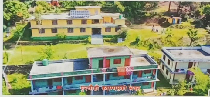
पुरचौडी क्याम्पसको भवन