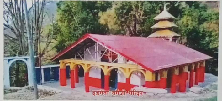
दडमेता समेजी मन्दिर