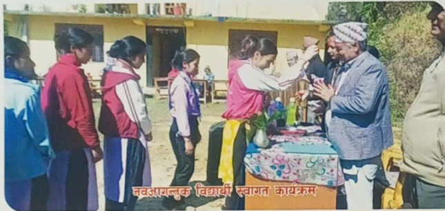
नवआगन्तुक विद्यार्थी स्वागत कार्यक्रम