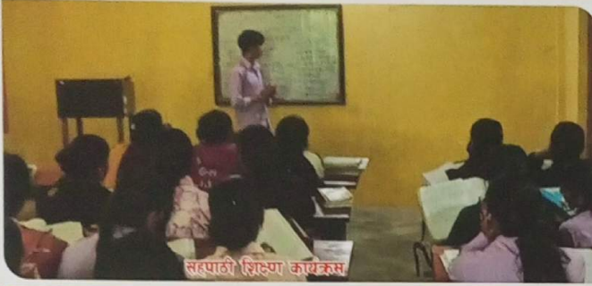
सहपाठी शिक्षण कार्यक्रम